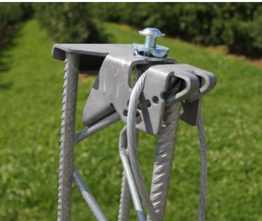
Kopfteil mit Ankerseil