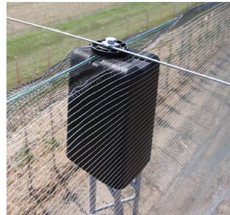
Schutzkappe, Netzring und Verschraubung