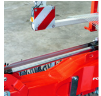
Steinschutz je Stern