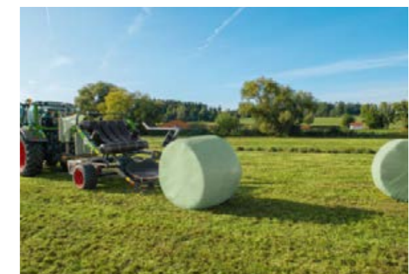
Sowohl der Ladearm als auch der Wickeltisch lassen sich an unterschiedliche Ballengrößen anpassen. Ballen mit einem Durchmesser von 1,25 m bis 1,6 m können sicher aufgenommen und luftdicht in Folie verpackt werden.