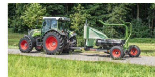
Praktisch: Bis zu drei Folienrollen finden Platz auf dem Rollector 130.