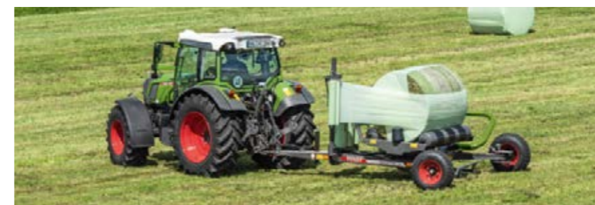
Der Fendt Rollector wickelt Ballen mit einem Durchmesser von 0,90 bis 1,30 m.