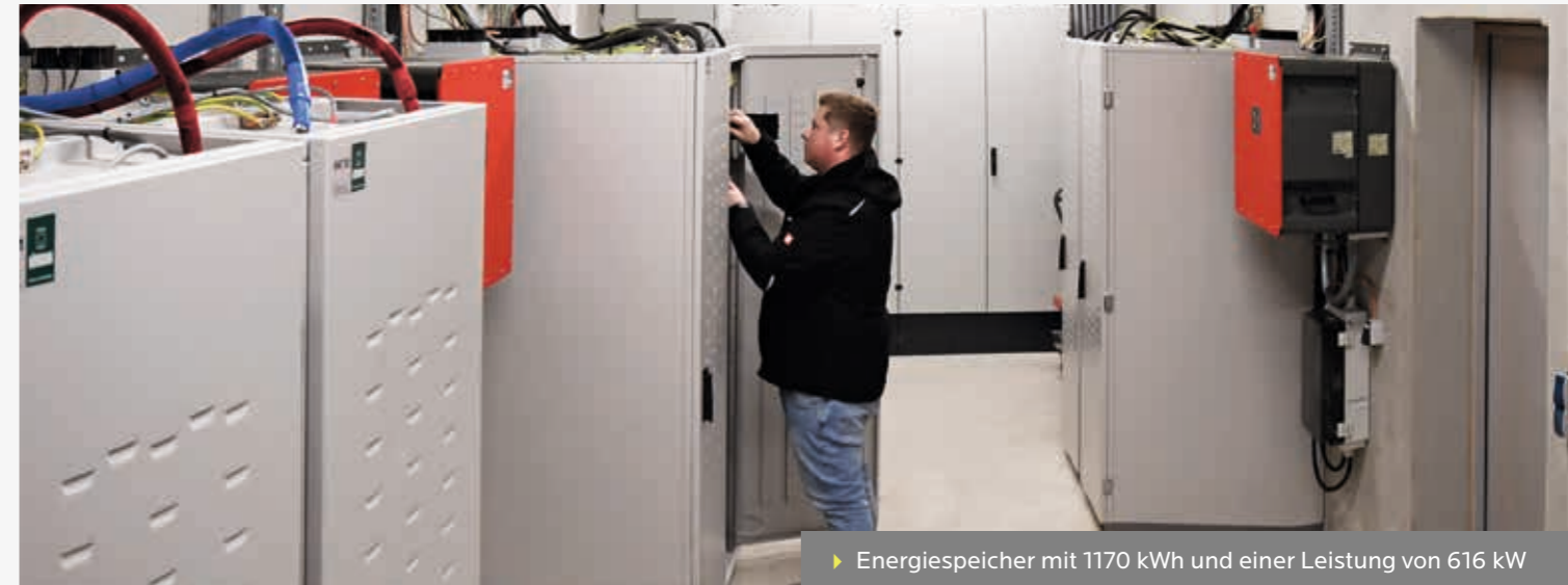
► Energiespeicher mit 1170 kWh und einer Leistung von 616 kW

Alle Gebäude am Standort in Buchloe sind seit 2003 mit unseren PV-Anlagen ausgestattet. Mit dem gewonnenen Strom laden wir unseren E-Fuhrpark auf, nutzen ihn im Büro sowie für sämtliche Produktionsmaschinen. Da wir doppelt so viel Strom erzeugen wie unser Betrieb benötigt, speisen wir die restliche Energie ins öffentliche Netz ein.