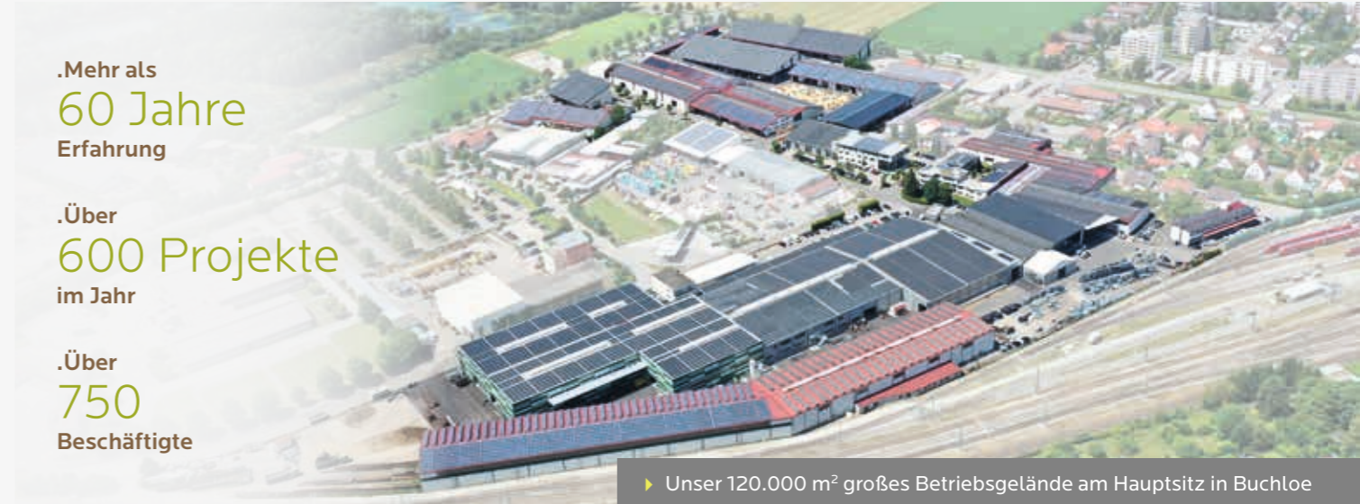
► Unser 120.000 m 2 großes Betriebsgelände am Hauptsitz in Buchloe

Seit über sechs Jahrzehnten sind wir, die Rudolf HÖRMANN GmbH & Co. KG, gefragt beim Planen und Bauen von Hallen, Wohngebäuden, Ställen und Reitanlagen. Angefangen bei der Planung über die Ausführung von Fundament- und Betonbauarbeiten, die fertige Gebäudehülle bis hin zur PV-Anlage sind wir Ihr Partner. Als Spezialist statten wir die Gebäude auch mit Photovoltaikanlagen aus.