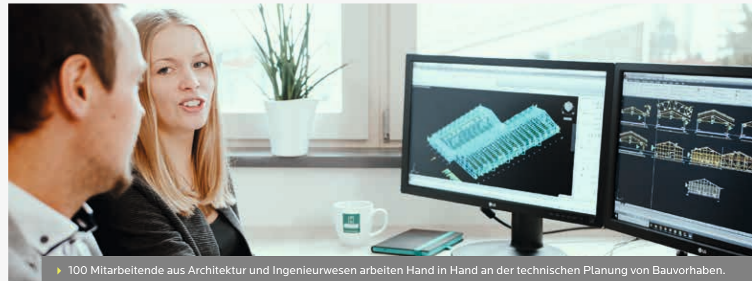
► 100 Mitarbeitende aus Architektur und Ingenieurwesen arbeiten Hand in Hand an der technischen Planung von Bauvorhaben.

Wer ein Gebäude baut, hat viel zu bedenken. Denn ein Bauvorhaben ist mehr als das Errichten eines Gebäudes. Wie gut, dass wir bei HÖRMANN uns mit allen Aspekten auskennen. Egal, ob bereits eine bauseitige Architektenplanung oder eine grobe Idee des Projektes besteht, wir beraten unsere Kundschaft individuell über die Planungs- und Bauphase.