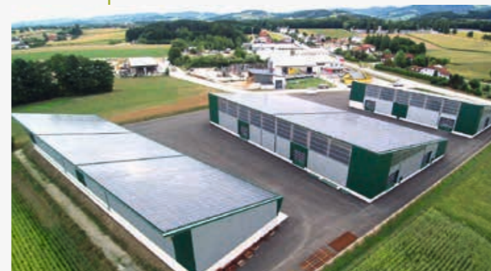
► Unsere Niederlassung in St. Peter/Au (AT)

Als inhabergeführtes Familienunternehmen denken und handeln wir nachhaltig für die nachfolgenden Generationen. Unser Ansporn ist es schon heute zukunftsweisende Gebäude für morgen zu verwirklichen. Wir erfüllen diese Aufgabe mit Hingabe und Fachwissen. Mit Expertise im Holz- und Stahlbau sowie über 20 Jahre Erfahrung im Bereich Photovoltaik entwickeln wir stets individuelle, ökonomische und ökologische Gebäudekonzepte. Das Vertrauen unserer Kundschaft und die freundschaftliche Zusammenarbeit mit unseren Geschäftspartnerschaften und Lieferfirmen ist unsere persönliche Motivation. Wir sehen uns als Partner des Mittelstandes. Der Schlüssel zum Erfolg ist das Engagement und die Einsatzfreude unserer Mitarbeitenden, die für unsere Kundschaft Tag für Tag die unterschiedlichsten Projekte umsetzen. In Deutschland, Österreich und der Schweiz haben wir für Sie einen persönlichen Kontakt ganz in Ihrer Nähe.