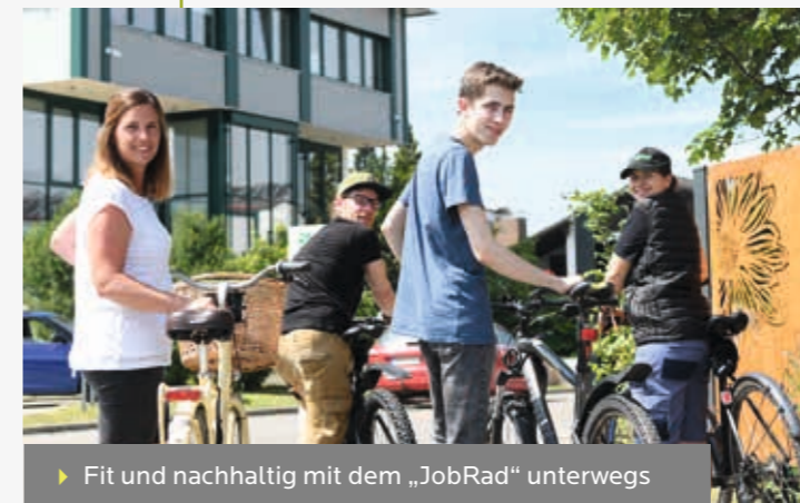
► Fit und nachhaltig mit dem „JobRad“ unterwegs

Für eine sinnvolle Weiternutzung von unseren „Abfall-Materialien“ dient unsere Hackschnitzelheizung. Das benötigte Material stammt komplett aus der eigenen Holz-Bearbeitung. Unser Warmwasserspeicher speichert das warme Wasser für die Raumheizungen und den Gebrauch in unseren Firmengebäuden.